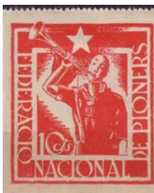
Imagen del saludo Pionero. Viñeta política catalogada en G.Guillamón nº 2396.