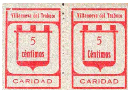
Tipo Ia - Ib Posiciones: 3 - 4