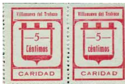
Tipo IIa - IIb Posiciones: 3 - 4