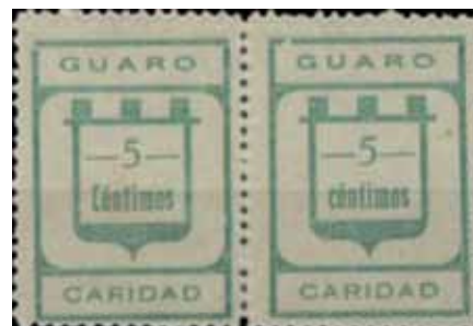
Tipo IIa - IIb Posiciones: 6 - 7