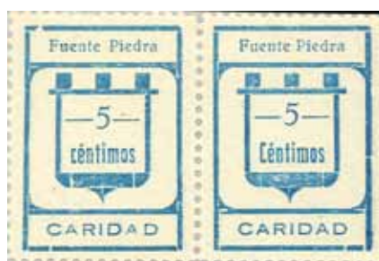
Tipo IIb - IIa Posiciones: 7 - 8